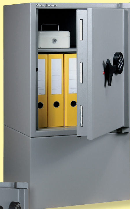
AG 15 avec socle