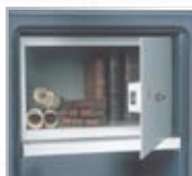
Equipements intérieurs (en partant de la gauche) : tablette, armoire à clé